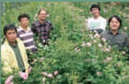
神戸町バラ生産組合のみなさん

神戸町のバラは土ではなく、ロックウールというマットの上で育てられているよ。これはロックウール栽培といって、土と比べるとマットの上という限られたスペースの中で作られるから、肥料や水などの管理が楽になり、バラの手入れをする時間が長くなって、より立派なバラに育てることができるんだ。