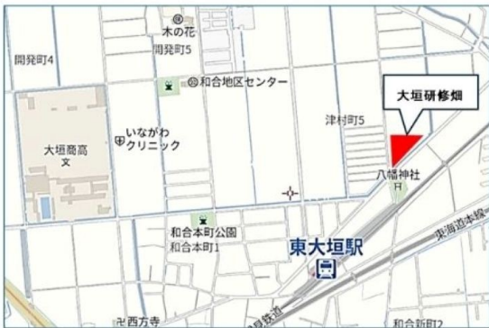
大垣圃場 【大垣商業高校 東方向】 (大垣市津村町3丁目155)