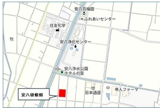
安八圃場 【安八百梅園 南方向】 (安八町牧4773-1~4775-1)